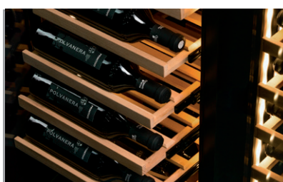
Mensole in legno ad estrazione Wooden shelves with sliding system