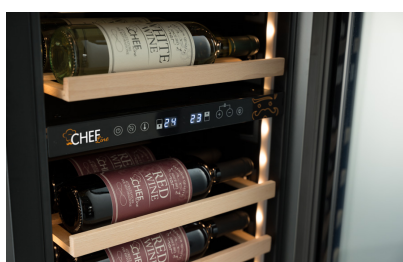
Termostato elettronico Electronic thermostat